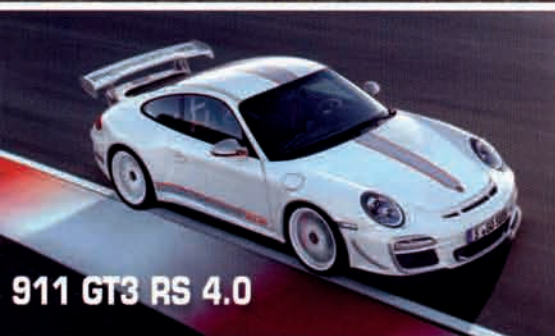
911 GT3 RS 4.0