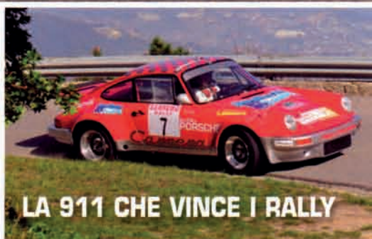
LA 911 CHE VINCE I RALLY